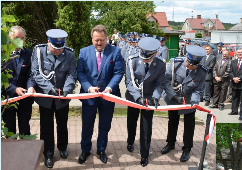
Posterunek Policji w Bakatazowie