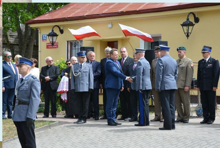
Służbę na posterunku pełni pięciu policjantów, w tym trzech dzielnicowych.