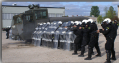
NIETATOWY ODDZIAŁ PREWENCJI