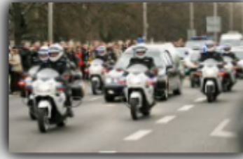
WSPÓŁPRACA Z BOR