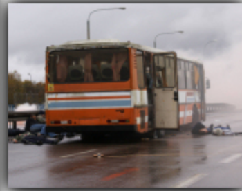
ZESPÓŁ DS. ZARZĄDZANIA KRYZYSOWEGO