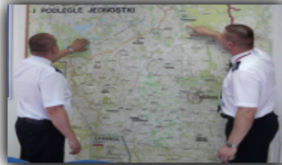
ZESPÓŁ OPERACJI POLICYJNYCH