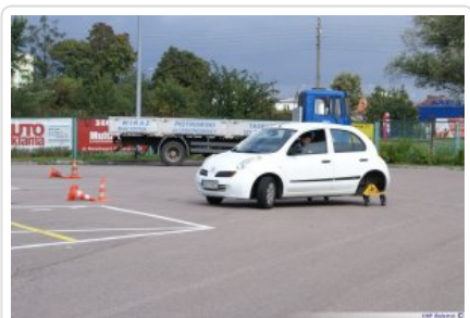
Kurs techniki jazdy