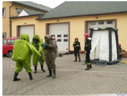
Szkolenie z ratownictwa chemicznego