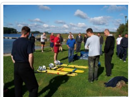
Kurs ratownika wodnego