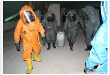
Szkolenie z ratownictwa chemicznego