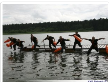
Kurs ratownika wodnego