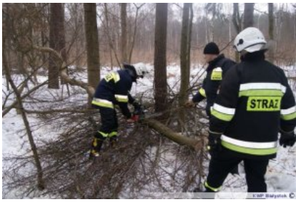
Szkolenie z przecinki drzew