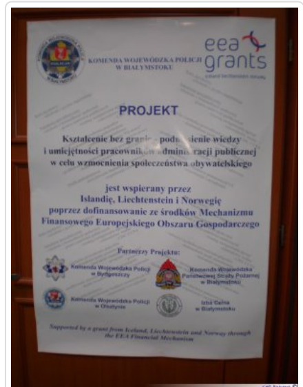
Inauguracja studiów 09