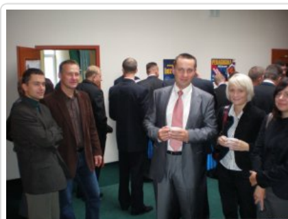
Inauguracja studiów 06