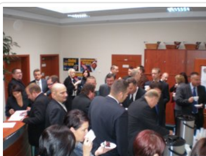
Inauguracja studiów 04