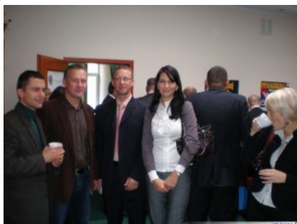
Inauguracja studiów 07