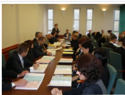
Inauguracja studiów 02