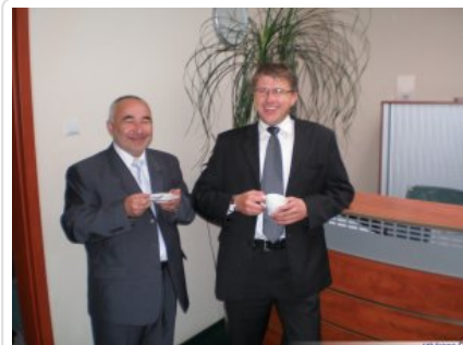
Inauguracja studiów 08