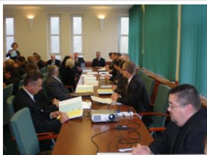
Inauguracja studiów 01

Inaugurację roku zakończyło uroczyste wręczenie indeksów studentom obu kierunków studiów.