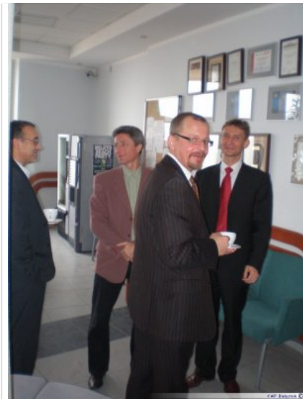
Inauguracja studiów 05