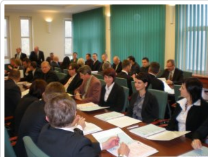
Inauguracja studiów 03