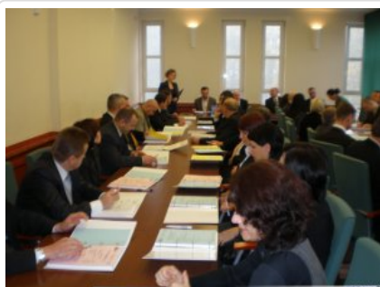
Inauguracja studiów 02