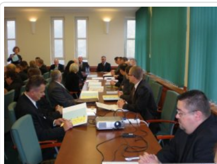
Inauguracja studiów 01

Inaugurację roku zakończyło uroczyste wręczenie indeksów studentom obu kierunków studiów.